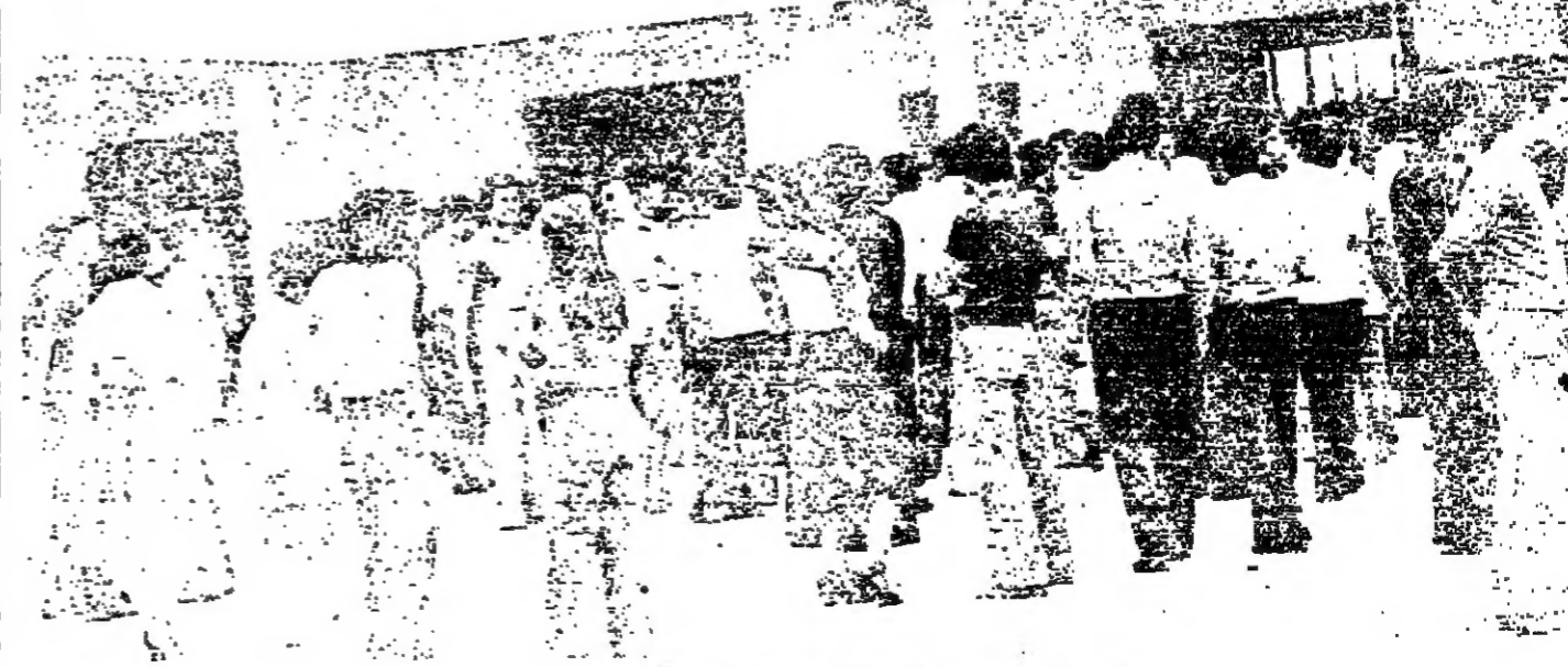
امام احد مراكز الامتحان في زحلة

زحلة - من مراسل « الانوار » : بدأت صباح امس في زحلة امتحانات شهادة الرياضيات والعلوم الاختيارية ، في جو هادئ وريح .